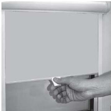
Подъем и опускание тканевого полотна